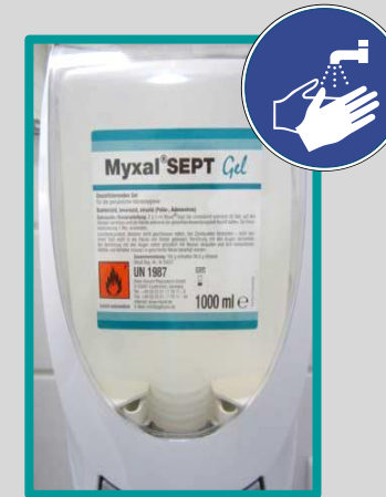
Desinfektion mind. 30 sec